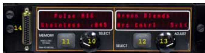
Панель специальных процессов