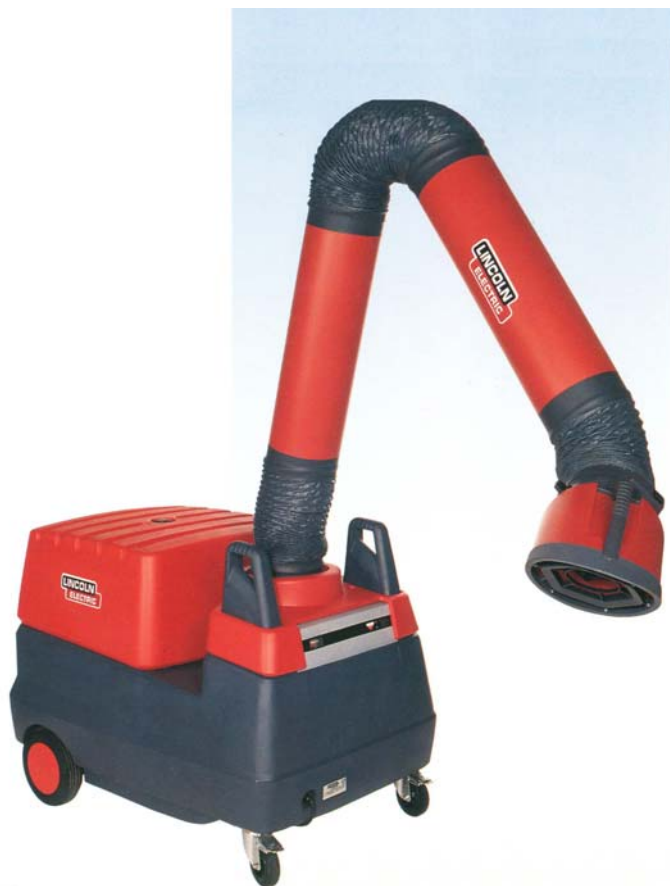
Mobiflex 200-M with 4 metre arm.

Мобильное низковакуумное вытяжное устройство Mobiflex 200-M предназначено для очистки окружающего воздуха и удаления сварочных газов и аэрозолей из рабочей зоны сварщика. Mobiflex 200-M используется при полуавтоматической сварке сплошной и порошковой проволокой в среде защитного газа, полуавтоматической сварке самозащитной порошковой проволокой, аргонодуговой и ручной дуговой сварке.