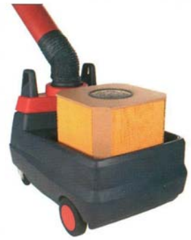
Фильтр и искрогаситель