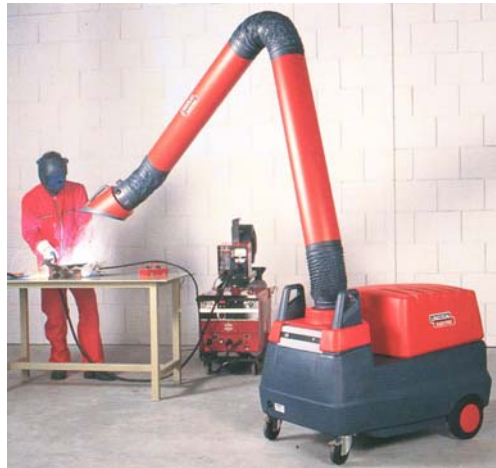
Mobiflex 200-M с 4 м рукавом